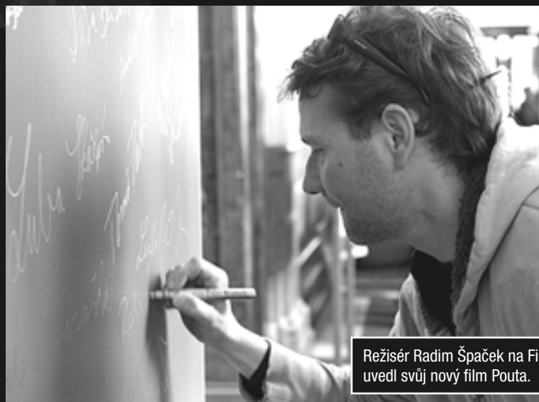
Režisér Radim Špaček na Finále uvedl svůj nový film Pouta.