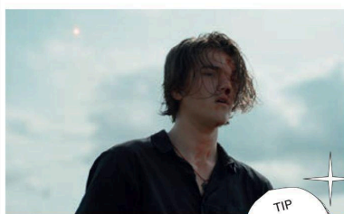
Brutální vedro pá 22. 9. 16:00 Kinosál, Měšťanská beseda

Gedeona, ač tak na první pohled vůbec nevypadá. Je velmi zábavný (i když lecky spíš podprahově), a zároveň podle mě velmi přesně vypovídá o pocitech dnešní mladé generace.