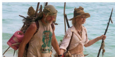
Ostrov pá 22. 9. 15:00 Malý sál, Měšťanská beseda